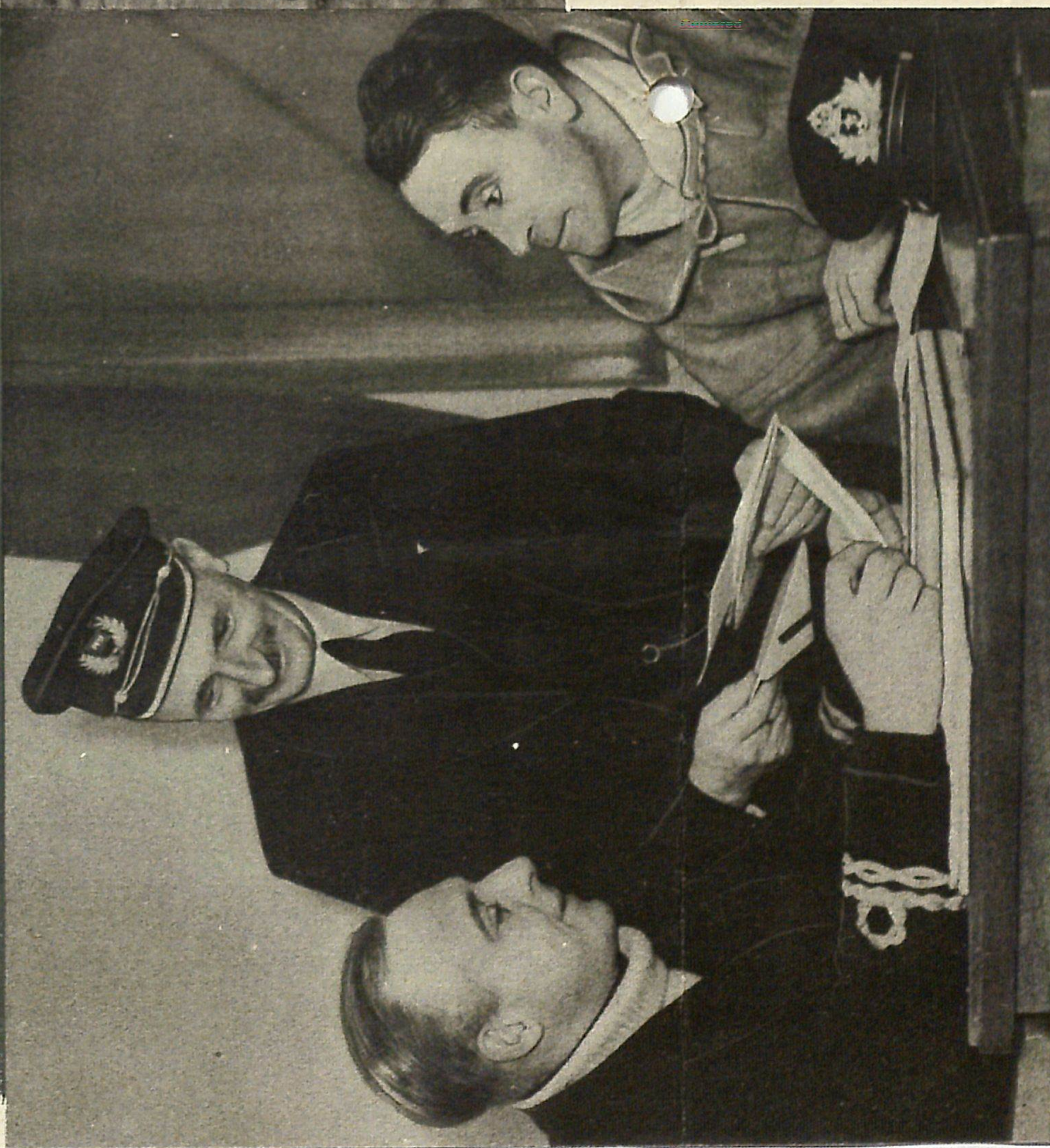
Ufficiale del Controllo Britannico che esamina garbatamente le carte di bordo di una nave neutrale

NEANCHE UN ITALIANO E STATO UCCISO PER MANO INGLESE L'INGHILTERRA NON HA FATTO NE BOMBARDARE NE AFFONDARE NAVI MERCANTILI ITALIANE